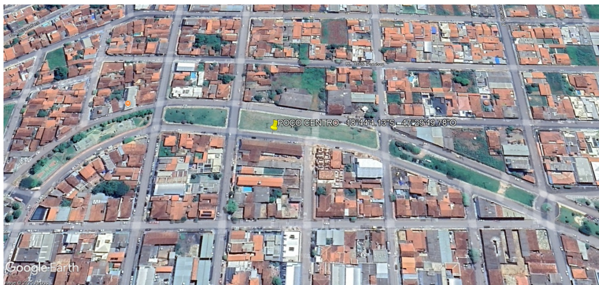
Figura 6: Local estimado para perfuração do poço bairro centro.