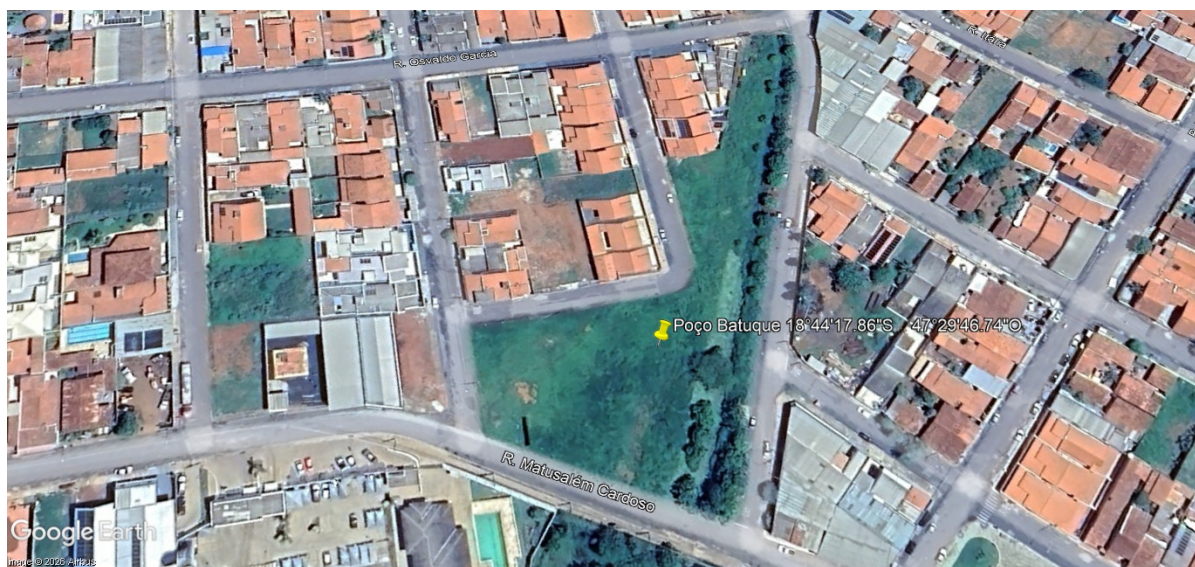
Figura8: Local estimado para perfuração do poço bairro Batuque.

Localização: (Rua A/Jose Soares do Amaral)