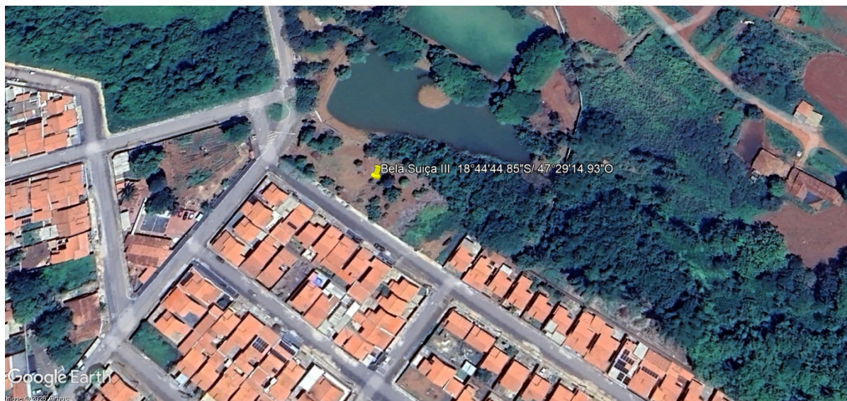
Figura 7: Local estimado para perfuração do poço bairro Bela Suíça.