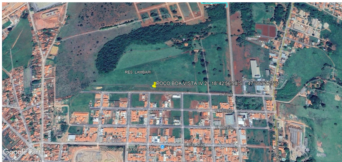
Figura 3: Local estimado para perfuração do poço bairro Lagoinha.

Localização: Rua Mandi esquina com a João Pinheiro.