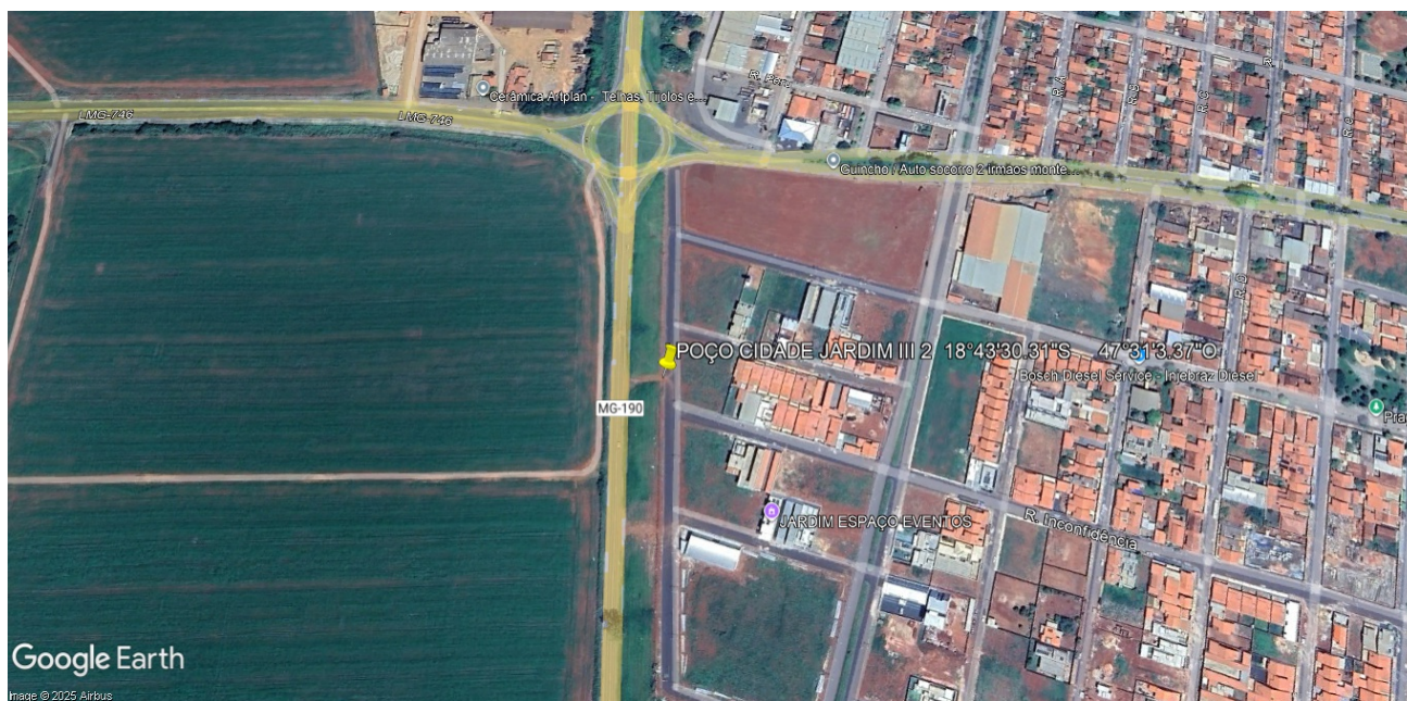
Figura 1: Local estimado para perfuração do poço bairro cidade jardim.

Localização: Final da Rua Inconfidência.