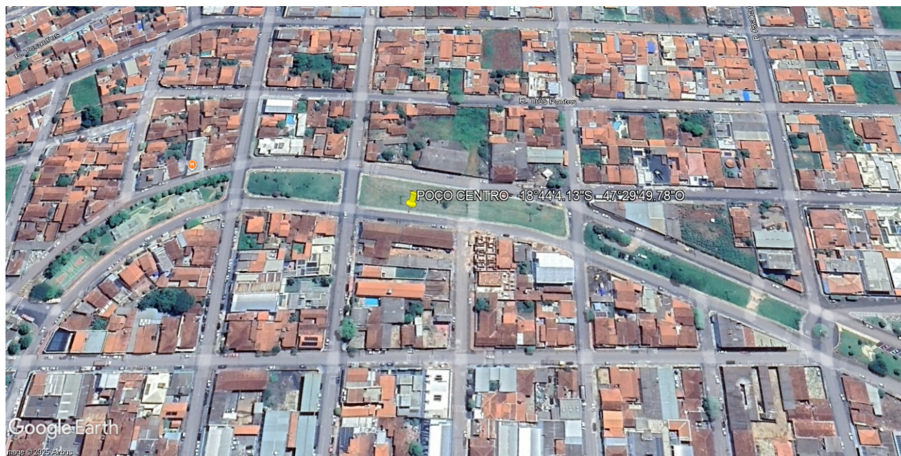
Figura 6: Local estimado para perfuração do poço bairro centro.

O poço tubular a ser perfurado deverá ter uma profundidade de 100 metros. Os primeiros 20,00