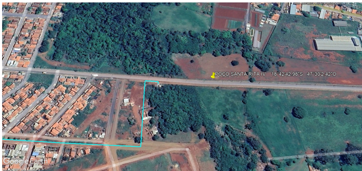
Figura 5: Local estimado para perfuração do poço bairro santa rita.