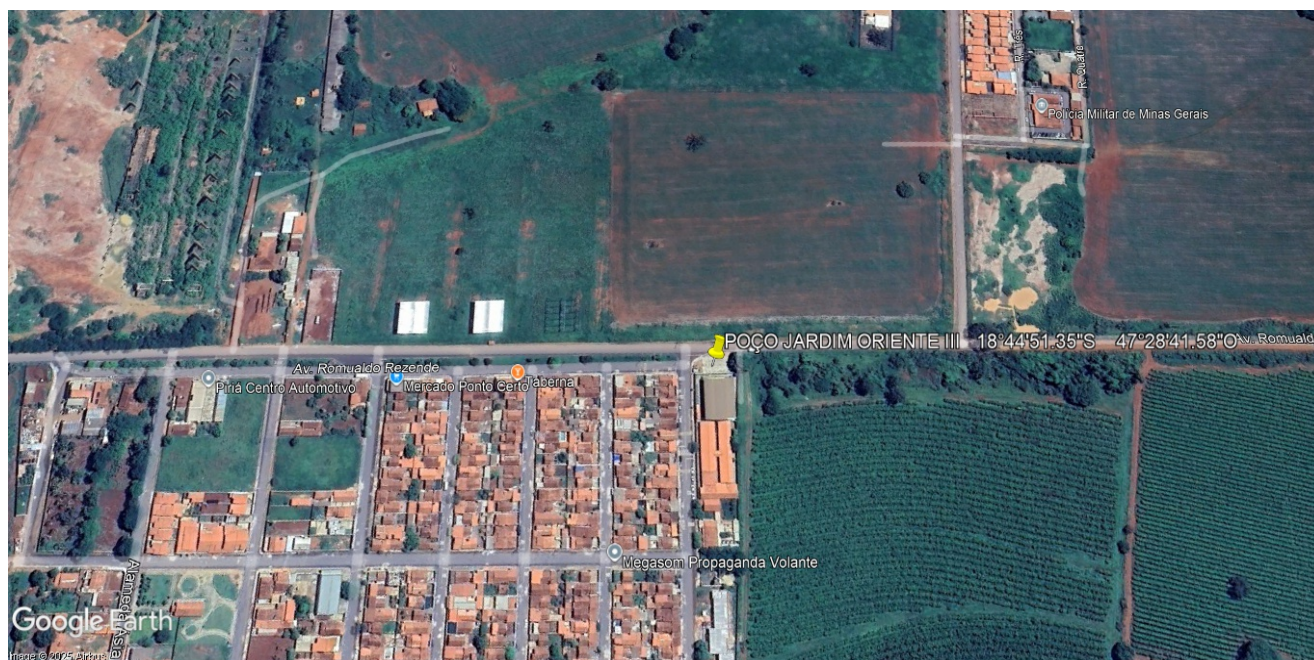
Figura 4: Local estimado para perfuração do poço bairro jardim oriente.

O poço tubular a ser perfurado deverá ter uma profundidade de 100 metros. Os primeiros 20,00 metros deverão ser perfurados para construção do tubo guia e para desenvolvimento da cimentação