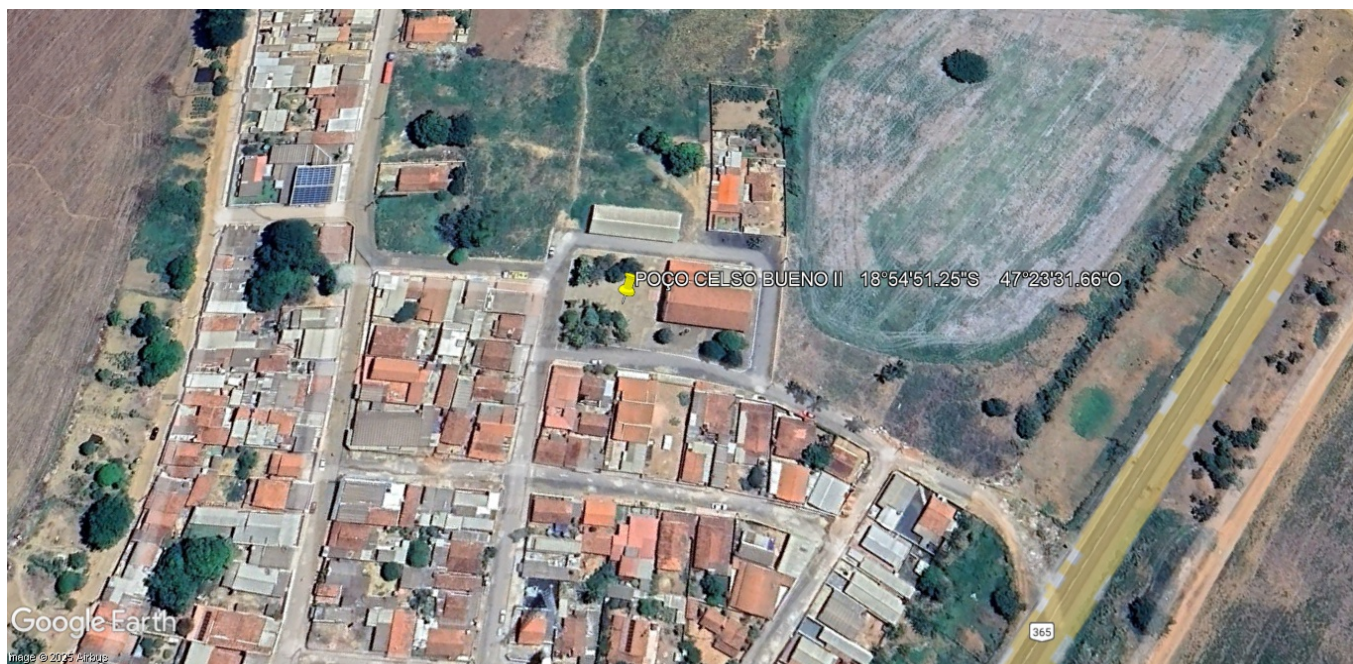
Figura 2: Local estimado para perfuração do poço (distrito celso bueno)

O poço tubular a ser perfurado deverá ter uma profundidade de 100 metros. Os primeiros 20,00 metros deverão ser perfurados para construção do tubo guia e para desenvolvimento da cimentação sanitária, cimentação de todo o espaço anelar ao longo dessa profundidade. A perfuração deverá ocorrer em sedimento(solo), utilizando o método rotativo com um diâmetro de 15" (381,0 mm). Do início aos 40,00 metros ou até o material rochoso, deverão ser perfurados em rocha parcialmente decomposta (saprólito), com um diâmetro de 12" (304,8 mm). Já os 60,00 metros restantes serão perfurados em maciço rochoso (rocha), com um diâmetro de 6" (152,4 mm). Nas perfurações em rocha, deverá ser empregado o método rotopneumático.