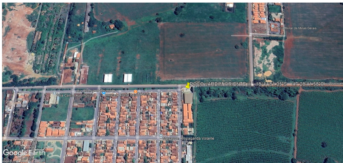
Figura 4: Local estimado para perfuração do poço bairro jardim oriente.

Localização: Av. Romualdo Resende esquina com Marieta Honorato