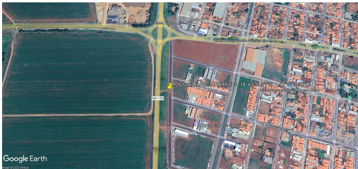
Figura 1: Local estimado para perfuração do poço bairro cidade jardim.

Localização: Final da Rua Inconfidência.