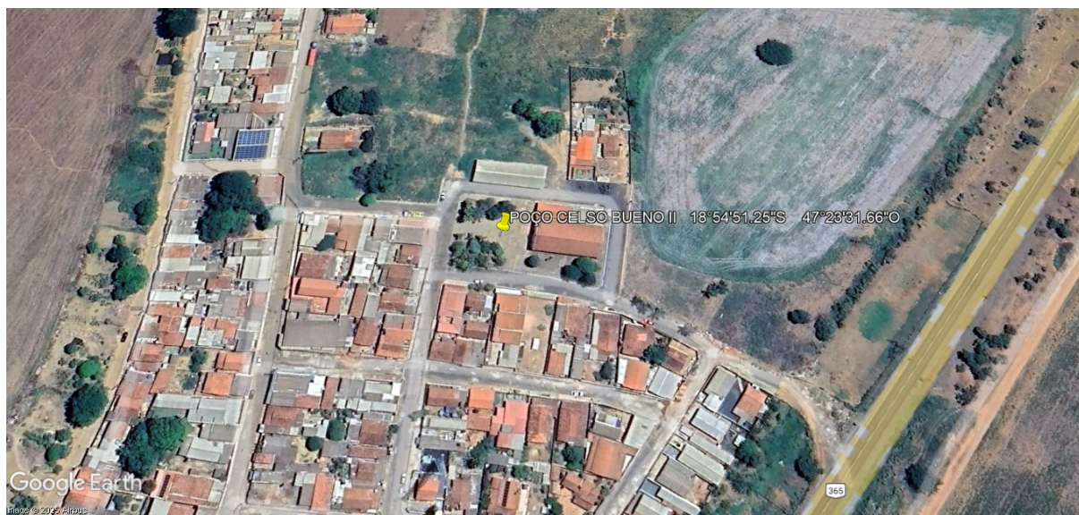
Figura 2: Local estimado para perfuração do poço (distrito celso bueno)