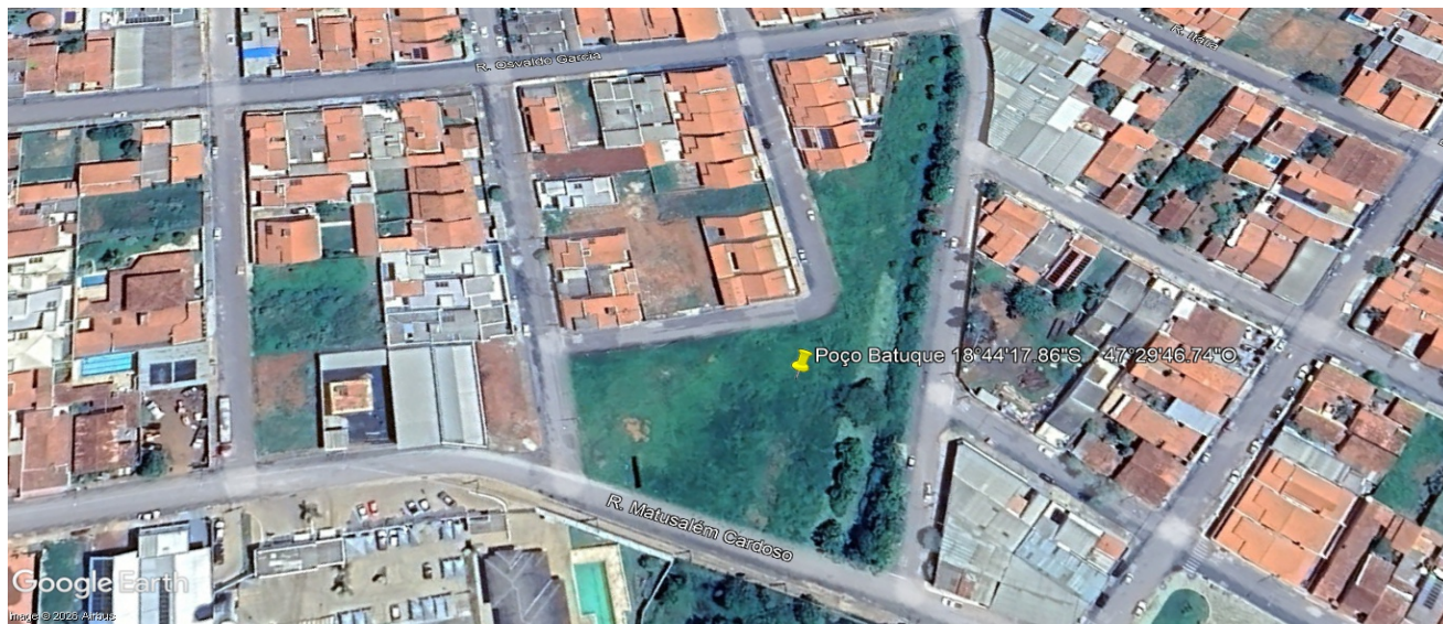
Figura 8: Local estimado para perfuração do poço bairro Batuque.

Localização: (Rua A/José Soares do Amaral)