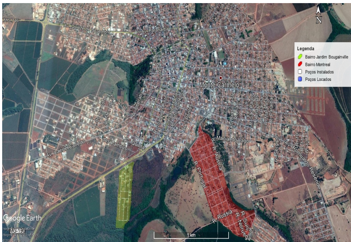
Figura 1 - Imagem Google Earth - Localização das áreas em 2018.

A área está localizada na porção sul do município de Monte Carmelo/MG, onde serão instalados dois poços tubulares no Bairro Jardim Montreal e um poço tubular no bairro Jardim Bougainville (Figura 1).