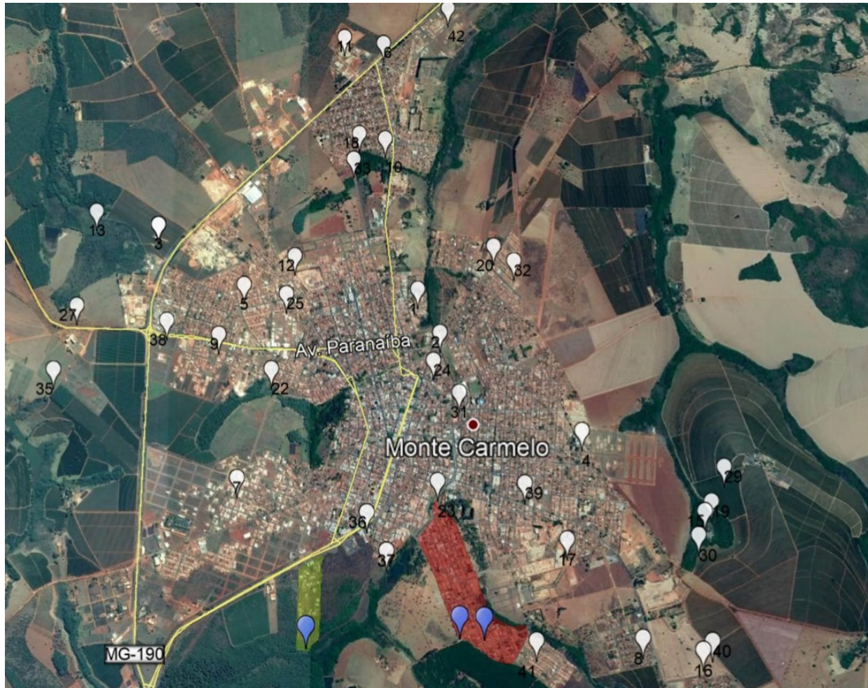
Figura 4 - Localização dos Poços tubulares Monte Carmelo/MG. Vermelho Montreau, Verde Jardim Bougainville.

M – Micaxisto, Formação Araxá, M/G – Micaxisto, Formação Araxá e Granitoides Complexo Monte Carmelo, G – Granitoides Complexo Monte Carmelo.