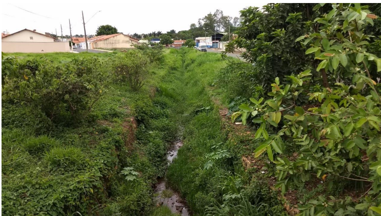
Foto 5 Córrego Mumbuca – trecho entre a Rua Matusalém Cardoso até a Avenida Romualdo Rezende.