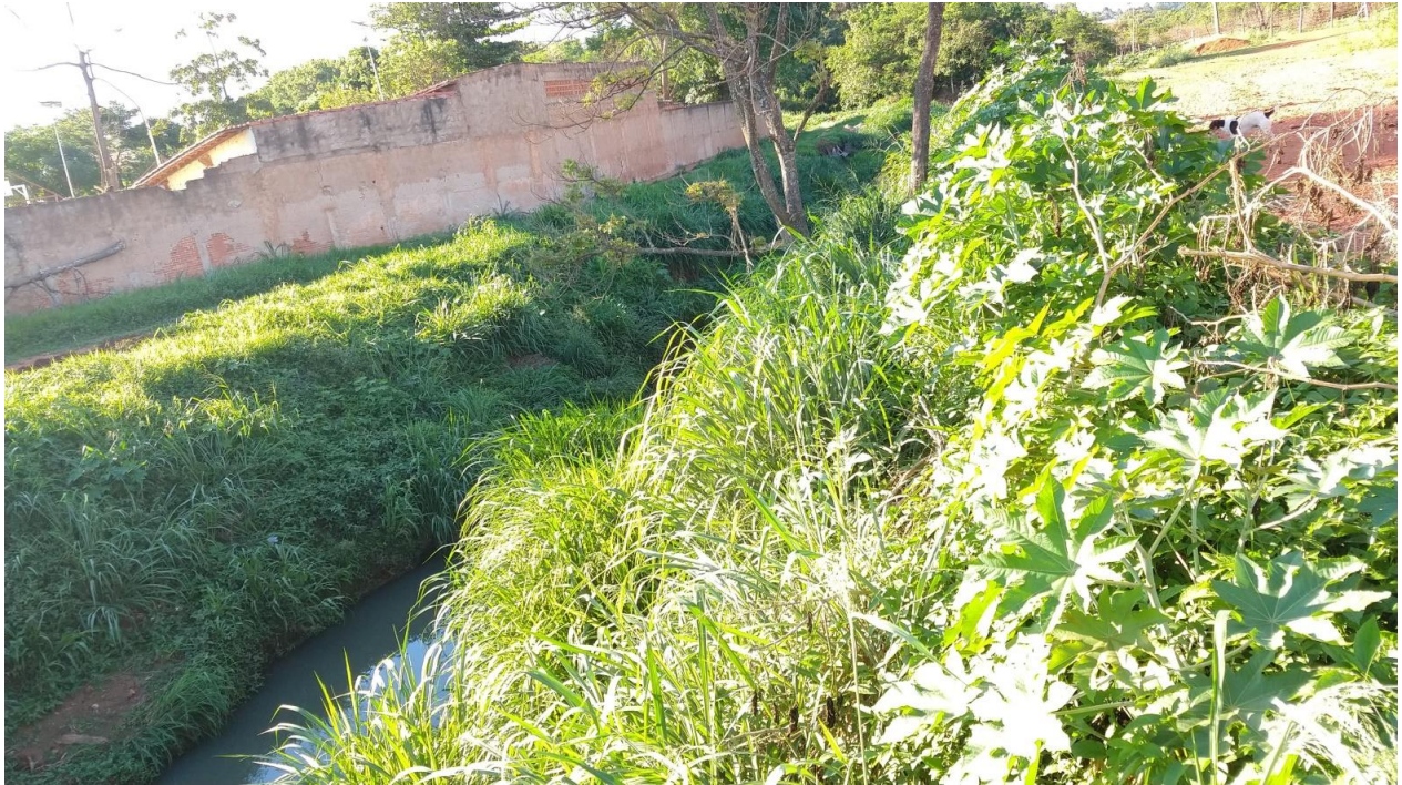
Foto 1 Córrego Mumbuca – trecho entre a Rua Alferes Euzébio até o Bairro Campestre