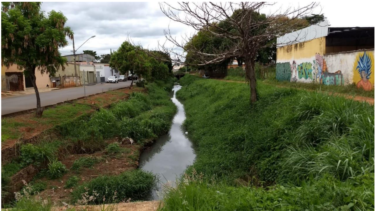
Foto 4 Córrego Mumbuca - trecho entre a Rua José Avelino até a Rua Alferes Euzébio