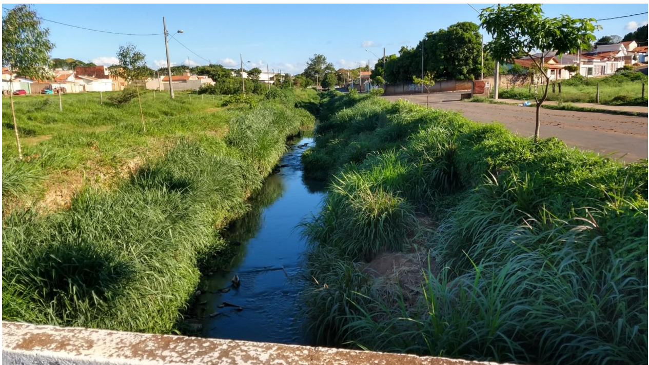
Foto 2 Córrego Mumbuca – trecho entre a Rua Alferes Euzébio até o Bairro Campestre