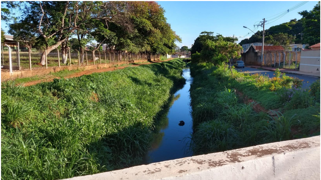
Foto 3 Córrego Mumbuca - trecho entre a Rua José Avelino até a Rua Alferes Euzébio