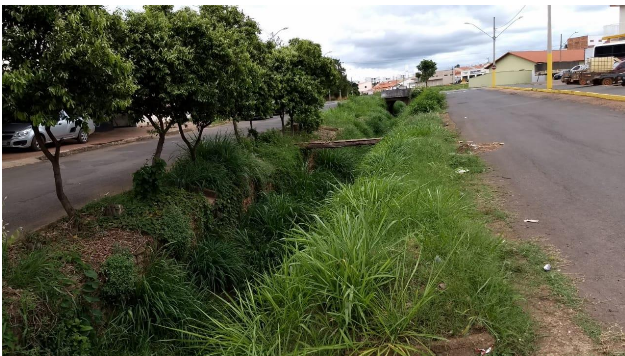
Foto 6 Córrego Mumbuca – trecho entre a Rua Matusalém Cardoso até a Avenida Romualdo Rezende.